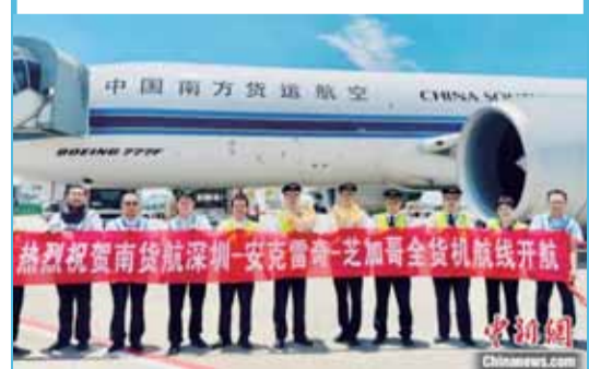
▲中國南方航空貨運有限公司近日正式開通深圳-安克雷奇-芝加哥貨運航綫。(中新網 郭軍)

在廣東知名僑鄉茂名信宜市，有一種流傳了150多年制法制作的花生糖，是粵西美食文化的標志性產品。對當地在外游子來說，家鄉的花生糖更是夢鄉裏的甜蜜，帶著滿滿的鄉土味道，記錄着兒時歡樂的回憶。