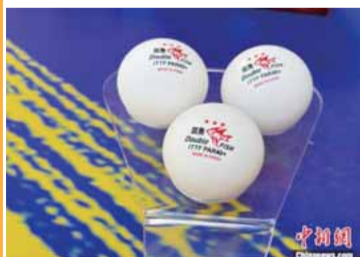
▲圖為廣州雙魚體育生產製造的巴黎奧運會比賽官方用球。