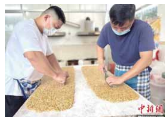
▲7月3日，信宜瑞興糖果店店員在手工制作花生糖。