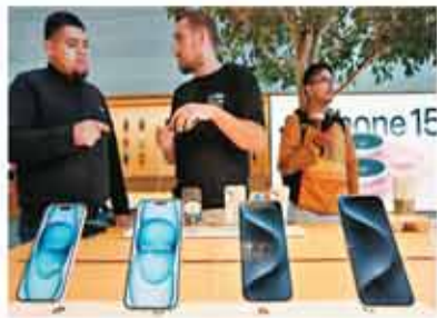
◆iPhone銷售額按年下降近1%。

落後，但許多投資者認為該公司的AI計劃將引發反彈。蘋果一直在AI競賽中追趕競爭對手，6月發布一系列新AI工具，投資者希望這些工具能鼓勵用戶升級iPhone。然而發布新工具所用的時間超過預期，蘋果早前表示，首批新的AI功能將無法在9月發布下一代iPhone作業系統iOS18時就位，要到數周後在iOS18.1中提供，其他AI功能要到今年稍後甚至明年才會推出，因此新功能給iPhone銷售帶來提振的時間可能要推遲。