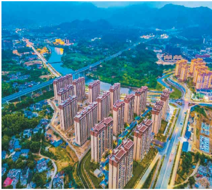
安徽省安庆市岳西县积极推进城镇化建设，增强县城综合承载力，改善居民生活品质。图为岳西县城与温泉镇交界地带，交通便捷，生态优美，规划有序，构成一幅美丽的城乡画卷。

财政部经济建设司司长符金陵介绍，中央财政目前形成了三方面支持政策体系：一是支持农业转移人口市民化，均等享受教育、医疗、住房保障