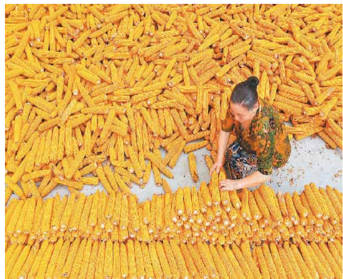
时下，重庆市黔江区低海拔地区的玉米相继成熟，村民们忙着采收和晾晒，确保颗粒归仓，实现增产增收。图为该区黑溪镇社区村民在晾晒玉米。

单机容量6.5兆瓦风电机组，配套建设50兆瓦/200兆瓦时储能系统，此次投运机组20台，装机容量100兆瓦。项目全容量并网后，每年可输送清洁电能5.4亿千瓦时，满足当地30万户居民一年的用电需求，与同等发电量的火电相比，每年可节约标准煤16.25万吨，减排二氧化碳44.5万吨、二氧化硫44.8吨、氮氧化物71.9吨，具有良好的经济效益、社会效益和社会效益。