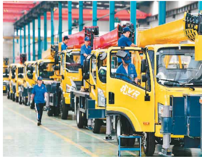
山东省济宁市任城区锚定新型工业化发展方向，着力做强新材料、高端装备、新一代信息技术三大主导产业，推动县域经济高质量发展。图为8月4日，在济宁四通工程机械有限公司总装车间，工作人员在吊车生产线上工作。

《绿色制造 制造企业绿色供应链管理 实施指南》、《绿色制造 制造企业绿色供应链管理 信息追溯及披露要求》等3项国家标准为制造企业建立和实施绿色供应链管理提供了全面系统的指导，将有助于规范制造企业绿色信息追溯及披露活动，有效解决绿色产品、绿色工厂及绿色供应链等绿色评价指标不协调、不系统、不一致等问题，助推制造业绿色可持续发展。