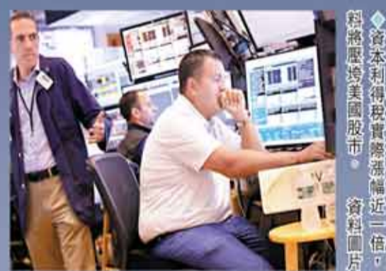
◆資本利得稅實際漲幅近一倍，料將壓垮美國股市。資料圖片