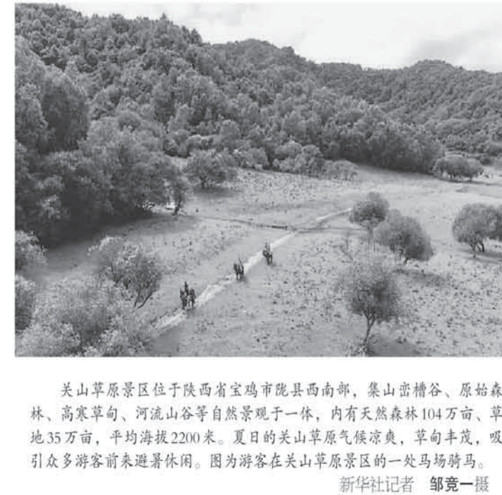
关山草原景区位于陕西省宝鸡市陇县西南部，集山峦叠嶂、原始森林、高寒草甸、河流山谷等自然景观于一体，内有天然森林104万亩、草地35万亩，平均海拔2200米。夏日的关山草原气候凉爽，草丰羊茂，吸引众多游客前来避暑休闲。图为游客在关山草原景区的一处马场骑马。

采茶、过秤、装车……都匀市毛尖镇螺蛳壳茶山，万亩茶园连绵，茶农们带着箩筐穿梭其中，一派繁忙。 “我们每天都要采摘茶青、管理茶园、修剪茶树，一天能赚180元，工作稳定离家又近，大伙儿都抢着干。”毛尖镇股份经济合作联社成员唐显刚说，不少农户还边干边学，成了土专家。 今年2月，毛尖镇7个村成立合作联社，推动标准化专业化茶园采摘管护服务，吸纳村民成为职业茶工。如今，合作联社已小有名气，周边不少乡镇都来购买服务。目前60多名茶工服务的茶园总面积达3900亩。 “之前一亩地一年管护费在1000到1200元，收入有3000元。现在采取机械和人工相结合的方式，管护费降到四五百元。”合作联社负责人张银说。 近年来，黔南州聚焦茶产业高质量发展，培育本地优质茶企，联合外地知名茶企，培育出“贵天下”“黄红缨”等都匀毛尖知名企业品牌，推出“云雾贡茶”“贵州金花茶”等黔南地方特色品牌，打造出“中茶牌”“八马牌”“元祖牌”等联名品牌产品。 “围绕茶园管护、茶青采摘、茶青加工等方面，发布了7个州级地方标准，制作132套都匀毛尖茶实物标准样本并开放茶企，指导全