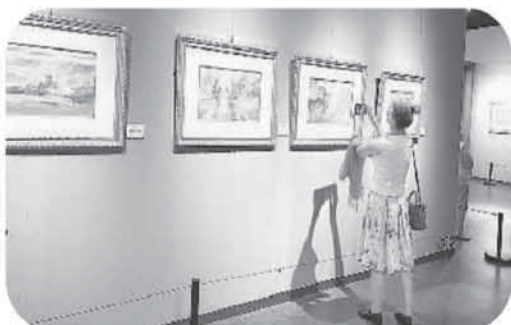
图为观众拍摄参展作品。

中国华侨历史博物馆副馆长宁一在开幕式致辞中表示，2024年是中法建交60周年，中国华侨历史博物