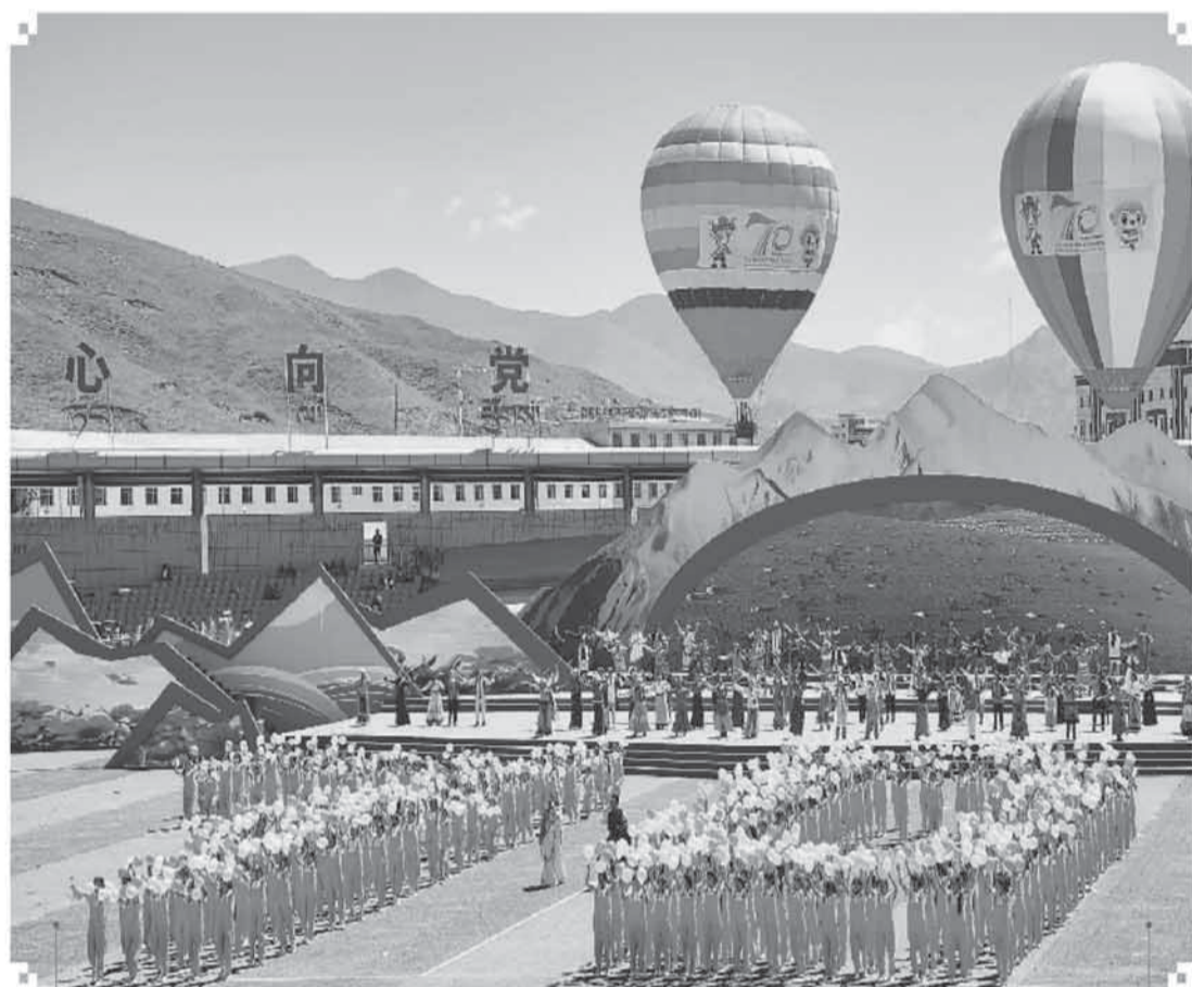
青海省果洛藏族自治州举行成立70周年庆祝大会 8月4日，青海省果洛藏族自治州成立70周年庆祝大会在玛沁县举行。70年来，果洛州各族儿女高举中华民族大团结旗帜，铸牢中华民族共同体意识，各民族像石榴籽一样紧紧抱在一起，构筑了中华民族一家亲的精神家园。图为各族群众在现场表演。

新华社北京8月3日电 国务院日前印发《关于促进服务消费高质量发展的意见》(以下简称《意见》)。 《意见》以习近平新时代中国特色社会主义思想为指导，全面贯彻党的二十大精神，完整准确全面贯彻新发展理念，加快构建新发展格局，统筹推进扩大内需和深化供给侧结构性改革，扩大服务业开放，着力提升服务品质、丰富消费场景、优化消费环境，以创新激发服务消费内生动力，培育服务消费新增长点，为经济高质量发展提供有力支撑，更好满足人民群众个性化、多样化、品质化服务消费需求。 《意见》提出6方面20项重点任务。一是挖掘餐饮住宿、家政服务、养老托育等基础性消费潜力。二是激发文化娱乐、旅游、体育、教育和培训、居住服务等改善型消费活力。三是培育壮大数字、绿色、健康等新型消费。四是增强服务消费动能，创新服务消费场景，加强服务消费品牌培育，放宽服务业市场准入，持续深化电信等领域开放。五是优化服务消费环境，加强服务消费监管，引导诚信合规经营，完善服务消费标准。六是强化政策保障，加强财税金融支持，夯实人才队伍支撑，提升统计监测水平。相关部门和各地共同开展服务消费提质惠民行动和服务消费季系列促消费活动，持续打造服务消费热点，推动服务质量提升。 《意见》要求各地区、各部门和有关单位坚决落实党中央、国务院决策部署，推动各项任务落实落地，共同促进服务消费高质量发展。