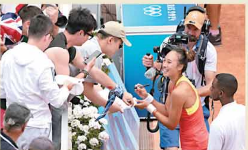
8月3日，鄭欽文奪得奧運網球女單金牌。圖為她為觀眾簽名。

路透社報道指出，鄭欽文這枚金牌，對中國是「歷史性的」。該社記者在現場觀察到，鄭欽文決賽中受到了大量中國球迷的熱烈支持，而她也以沉着的表现作出了回應。雖然維基奇奮力拚搏試圖扭轉局面，但鄭欽文「當之無愧地」獲得了她職業生涯的這場最大勝利。