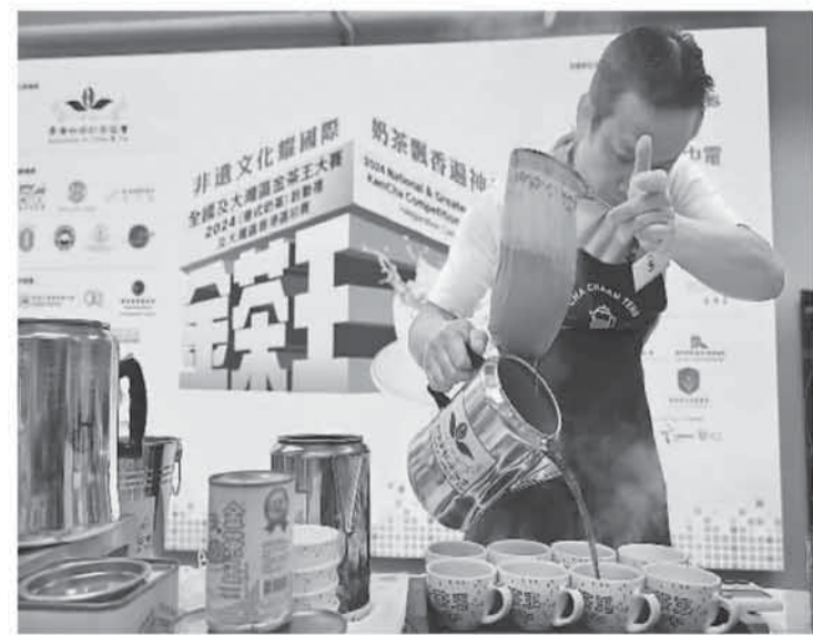
2024年金茶王（港式奶茶）大赛近日在香港启动，经选拔的25位奶茶师傅在比赛中展示精湛技艺。港式奶茶制作技艺于2017年成为首批列入“香港非物质文化遗产代表作名录”的项目，也俗称为“丝袜奶茶”。图为参赛者傅在冲泡奶茶。

据介绍，“双城青年文化人才交流计划”自2022年推出后，已有近130位京港优秀大学生参与。