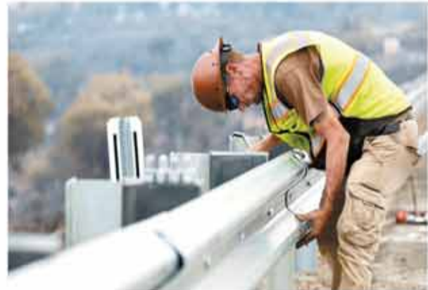
◆美國經濟一旦喪失動能，將導致失業、債務拖欠、企業倒閉等逆風驟然增強。

金融市場訊號也響起警號。紐約聯儲銀行根據學息曲線斜率變化，預測未來一年經濟衰退率超過50%；美股升勢顯然也難以為繼。人工智能(AI)概念股回軟使標普指數更疲弱。問題是等到9月會議時，美聯儲可能因經濟快速下滑而一次減息半厘，這反而會令市場對經濟展望更擔憂。