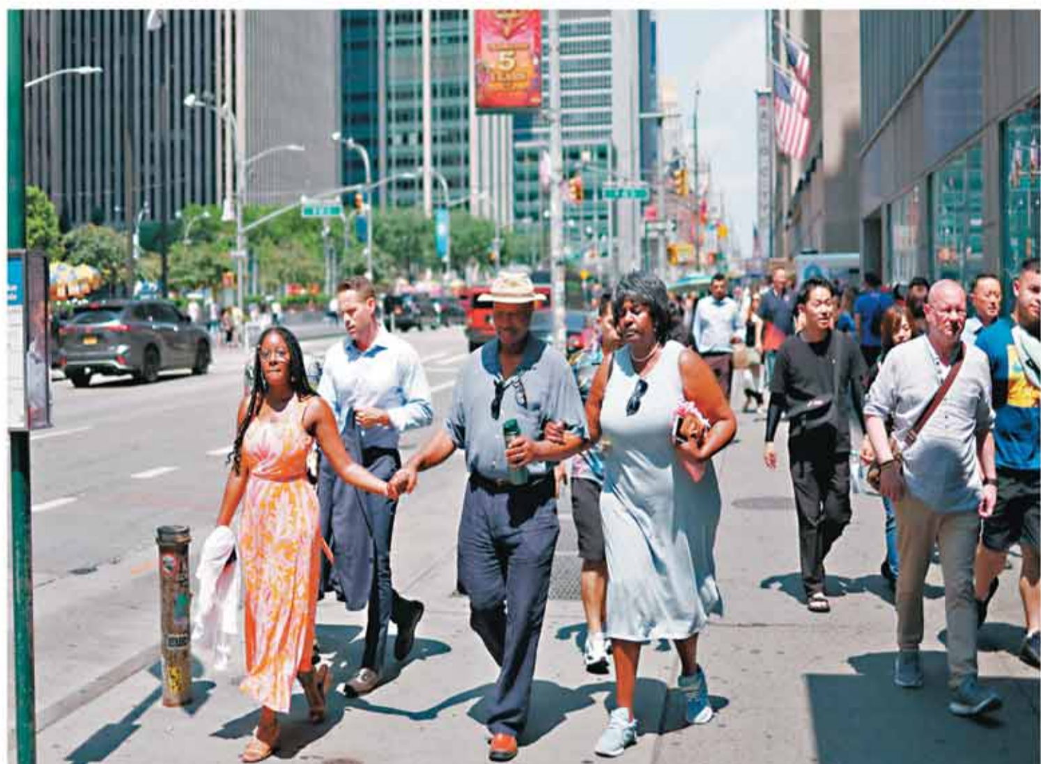
◆分析指巴菲特看淡美國整體經濟前景及美股未來走向。圖為美國紐約街頭行人匆匆。

香港文匯報訊「股神」巴菲特的投資旗艦巴郡上周六(8月3日)公布今年第二季度業績，顯示集團減持近半蘋果公司股份。這已是巴郡連續兩季度減持其最大持倉蘋果的持股，令市場震驚。巴郡全季淨出售755億美元股票，持有的現金增至破紀錄的2,769億美元。