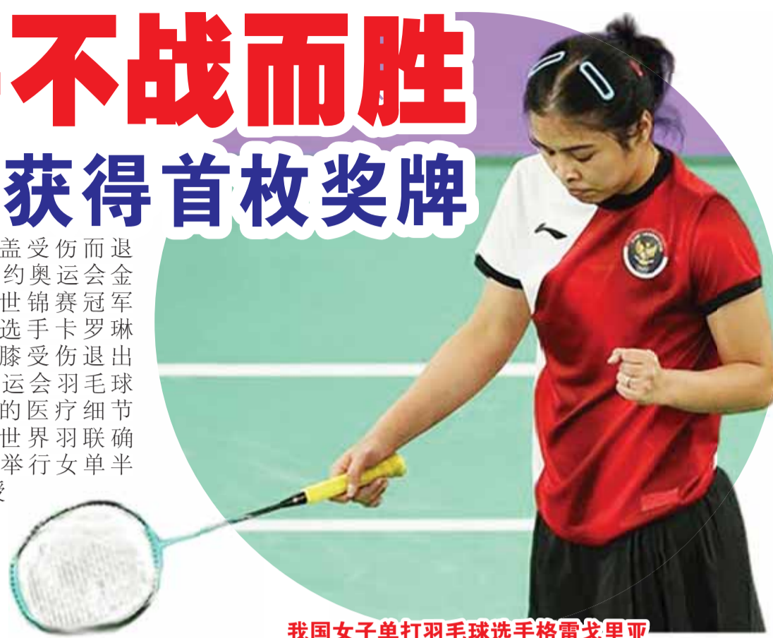
我国女子单打羽毛球选手格雷戈里娅