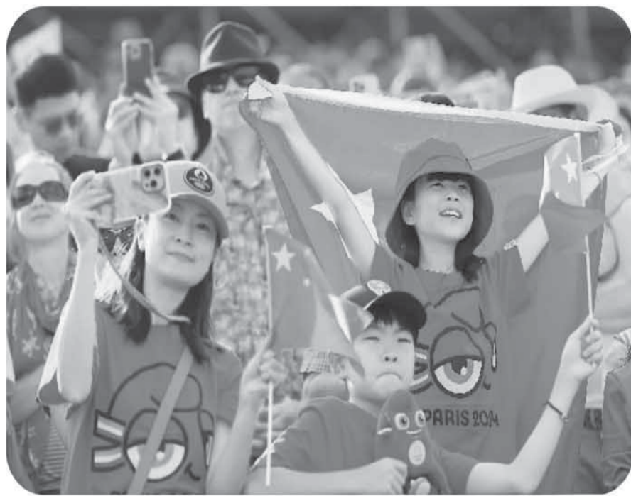
近日，几名观众在巴黎奥运会射箭女子团体金牌赛看台上观赛。

见证了巴黎时隔百年再次与夏季奥运会“牵手”，更有机会近距离为中国奥运代表团加油助威。而在感受奥运火热氛围的同时，不少华侨华人也以各种方式为巴黎奥运会的成功举办以及中外人文交流贡献力量。