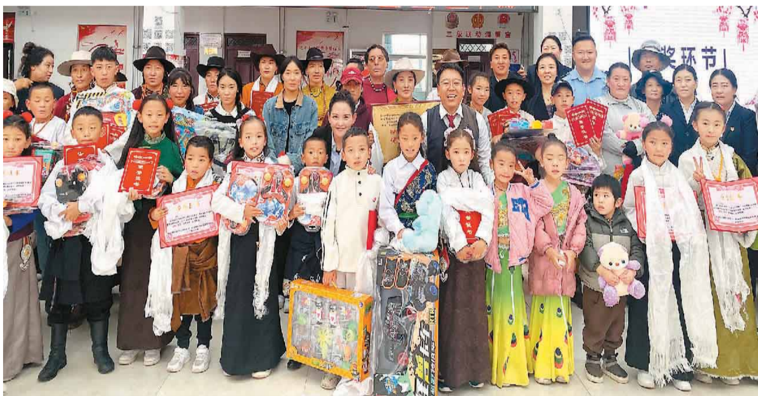
图为果洛藏族自治州达日县吉迈镇开玛社区民族团结（石榴籽家园）社区文艺活动。

果洛的干部群众纷纷表示，将以党的二十届三中全会精神为指引，意气风发沿着中国式现代化新道路，倾力打造生态文明高地，扎实推动“四地”建设，全面推进乡村振兴，提升社会治理效能，奋力谱写现代化果洛建设新篇章。