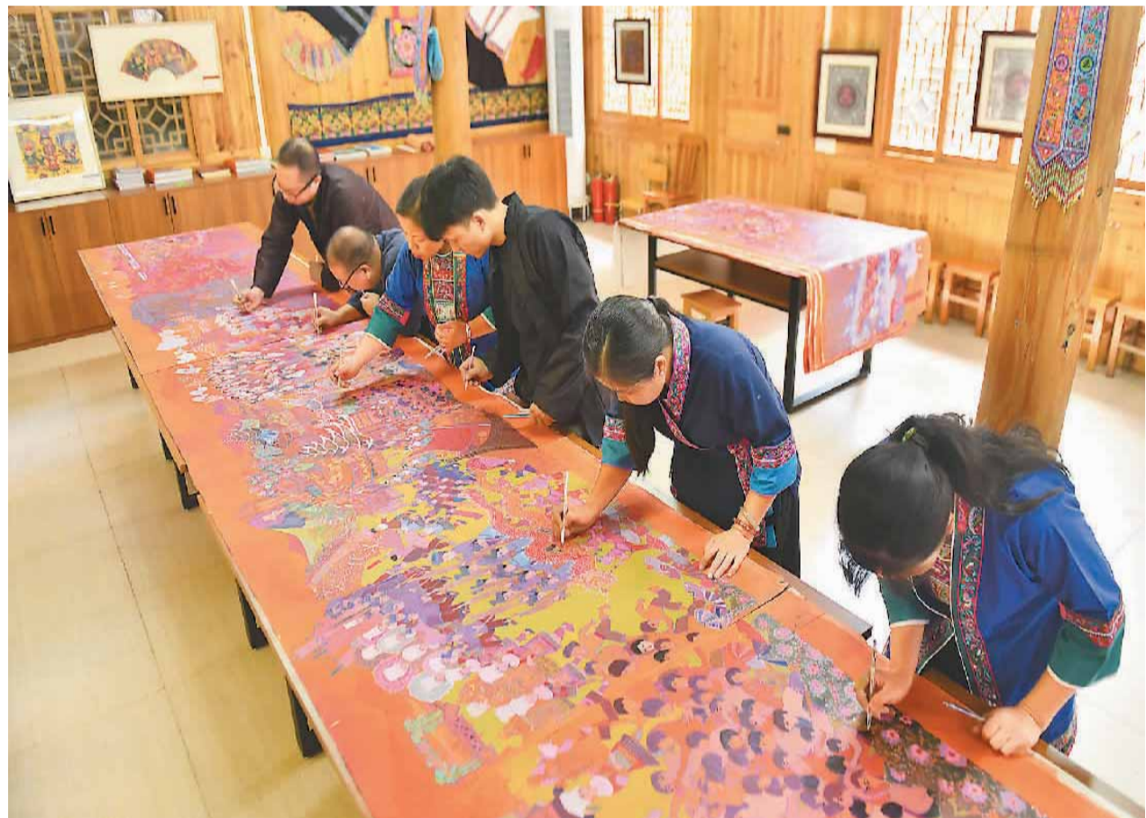
广西柳州市三江侗族自治县大力推动农民画产业发展，助力乡村振兴。三江侗族自治县农民画是自治区级非物质文化遗产项目。目前，全县有农民画作者超过600人，三江农民画产业的年产值超500万元，是当地农民增收的重要渠道之一。图为该县民族实验学校农民画工作坊内，侗族农民画作者在集体创作长卷作品。