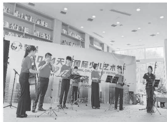
图为台湾大中青少年国乐团在舞台上演奏。