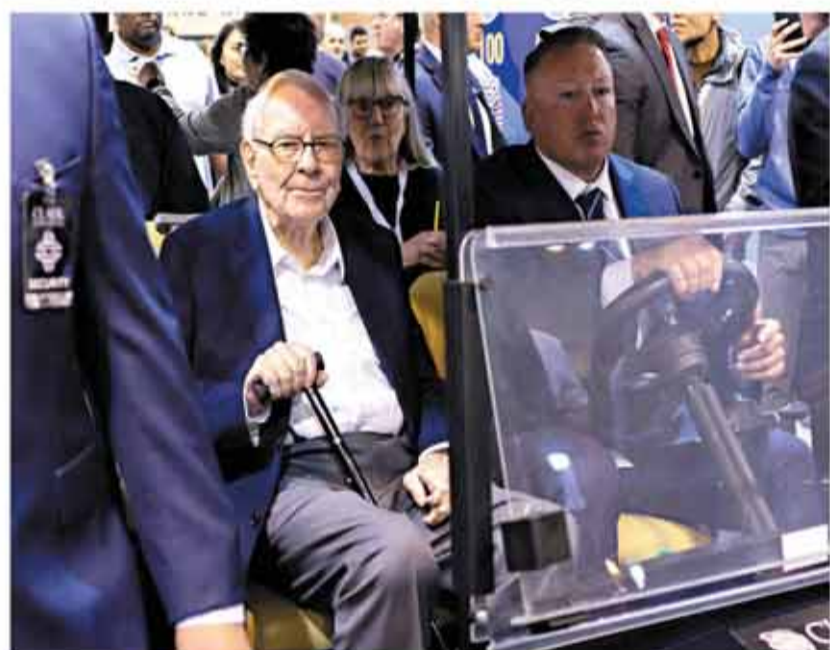
◆巴菲特(左)指今年出售部分蘋果股票，將使巴郡股東受益。

巴菲特稱若美國政府希望彌補不斷攀升的財赤，將會提高資本利得稅，那麼從長遠來看，今年出售部分蘋果股票將使巴郡股東受益。