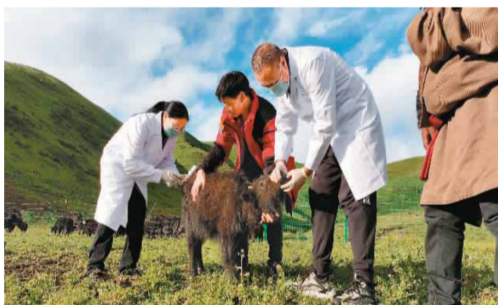
图为果洛藏族自治州久治县动物疫病预防控制中心工作人员给牧民家中的牦牛“体检”。