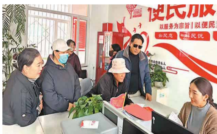
图为果洛藏族自治州玛沁县大武镇黄河路南区居民来社区办事。